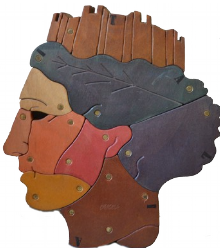
Italia legno okoumè dipinto 36x30x9 cm