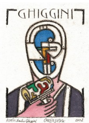
RDM di Emilio Ghigginì, 2002