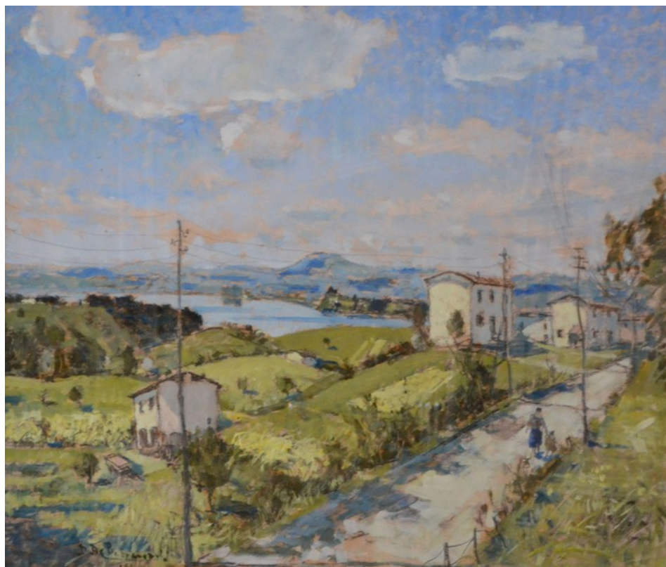
Paesaggio varesino, 1951, olio-tavola, 56x65 cm