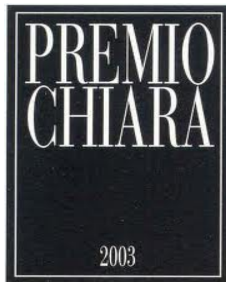
Catalogo della mostra Protagonista del paesaggio varesino

Mostra in galleria 2011-2012 GHIGGINI EDIZIONI