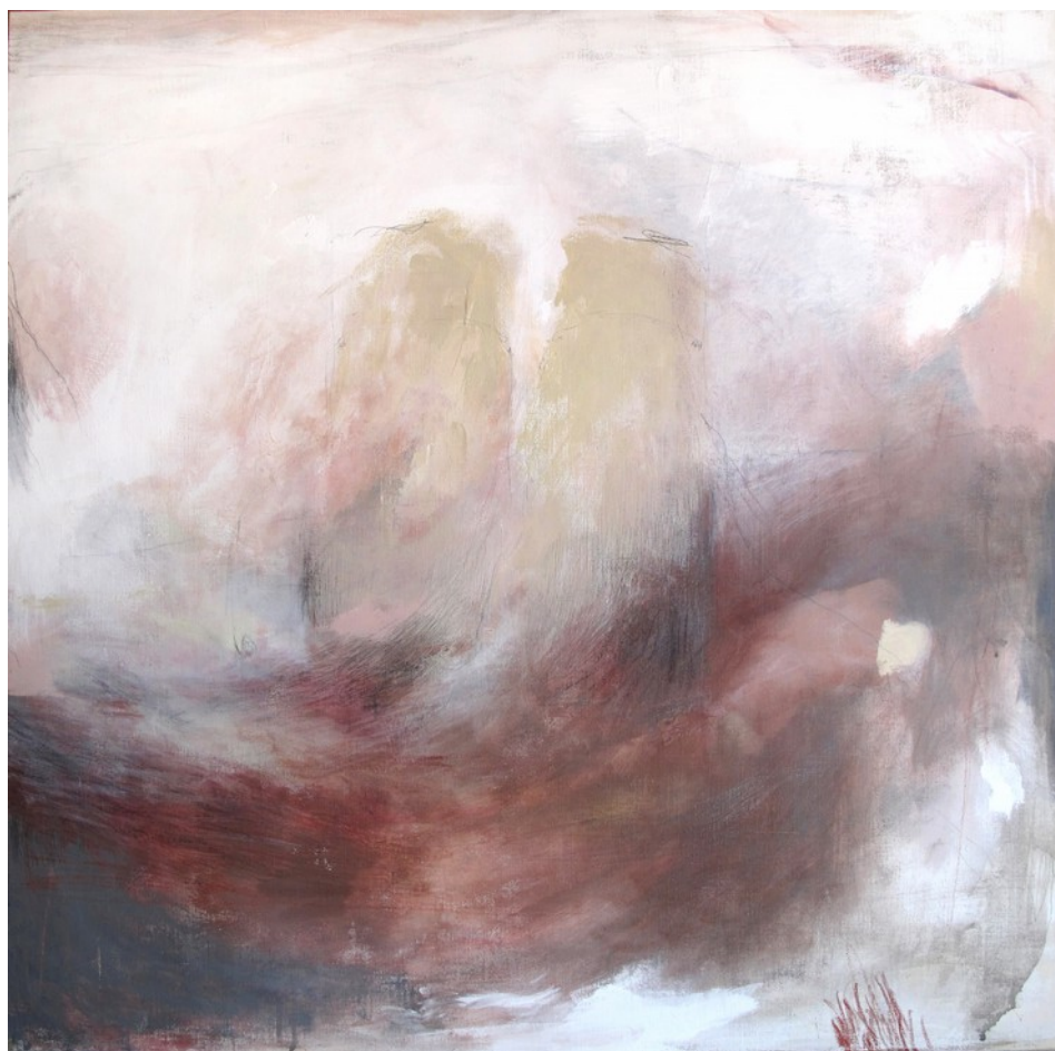
Pagine, 2017, tecnica mista su tela, 100x100 cm