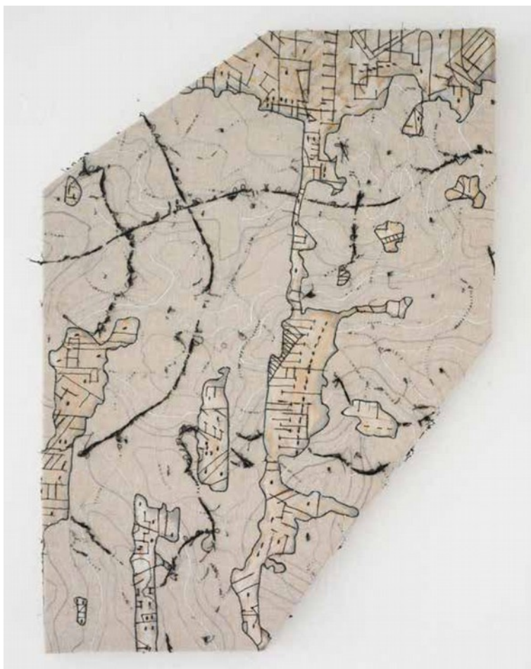
Antichità romane, 2018 tecnica mista e cucitura su tela, 82x58 cm