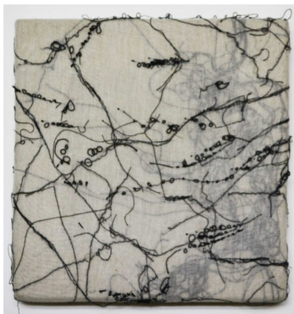
Syria Project, 2017 cucitura su garza, 20x20 cm