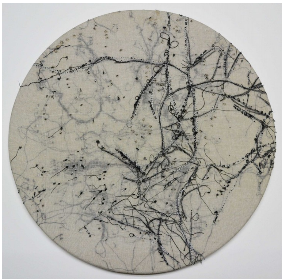
Tracciato, 2017, cucitura su garza, 48 cm (diametro)

G iulio Locatelli (Bergamo 1993) è diplomato presso l'Accademia di Brera a Milano. Partecipa nel 2016 al concorso indetto dalla galleria, il Premio GhigginiArte giovani XV edizione, risultando secondo classificato. Le opere di Giulio offrono un suggestivo equilibrio fra segno e materia che si ottiene attraverso una sapiente combinazione di cuciture su diversi materiali come carta handmade , tela e garza.