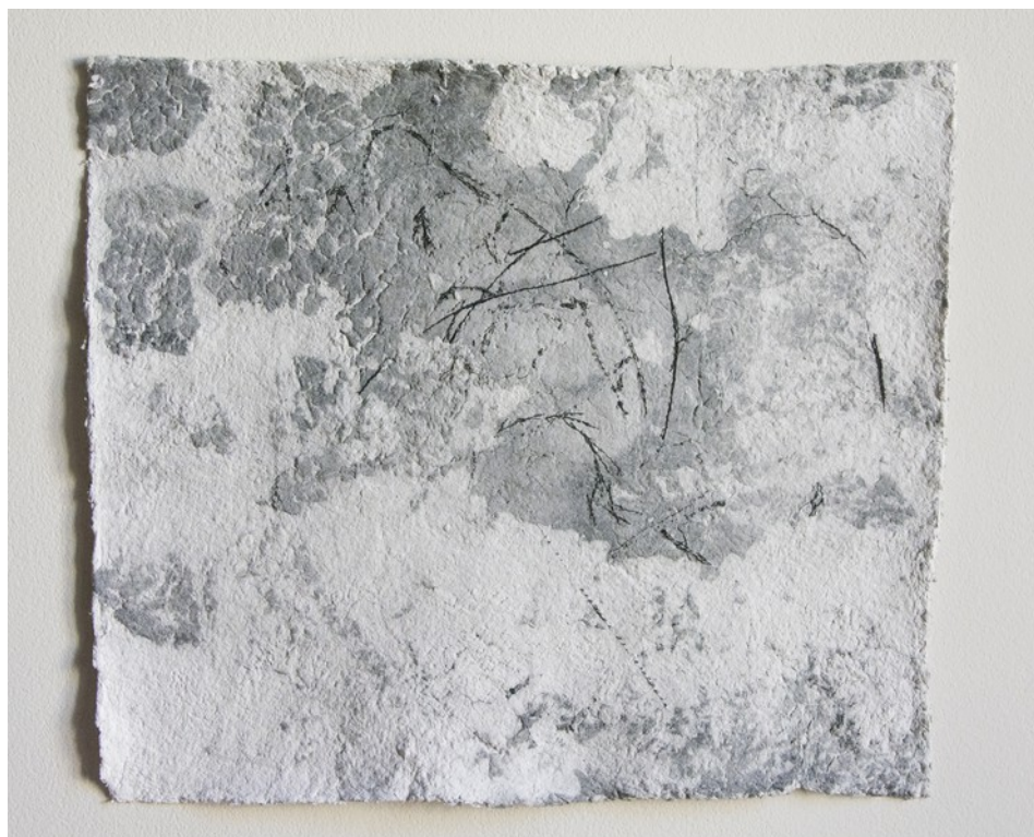
Suture, 2016, cucitura su carta handmade, 37x45 cm