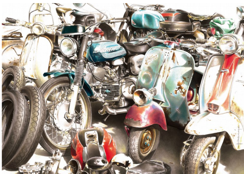
Souvenir, 2015 acquerello su carta, 50x70 cm