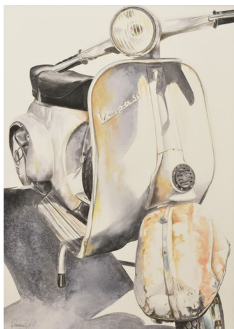
BA 131, 2016 acquerello su tela 70x50 cm