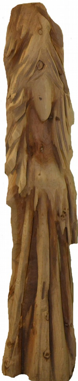
Figura del bosco, legno 123x30x25 cm