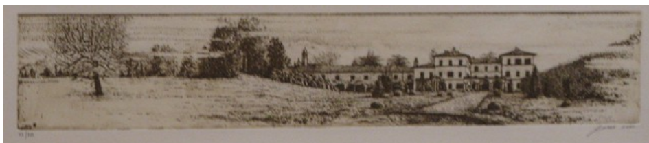
Varese, Villa Panza, 2001 acquaforte, foglio 260x500 mm