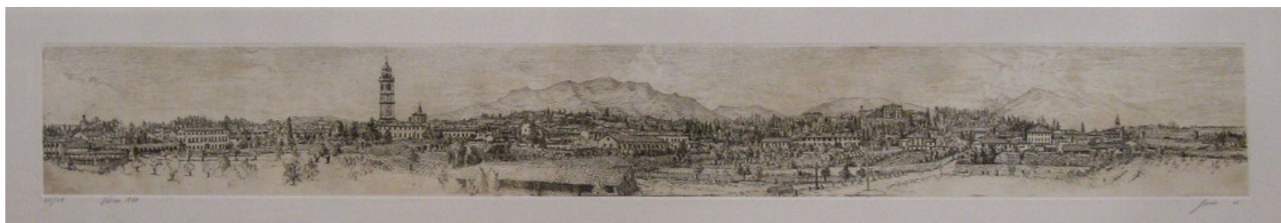
Varese com'era (1870 circa), 2001, acquaforte, foglio 245x1260 mm