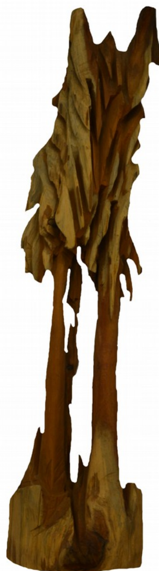
Bosco, legno 83x20x30 cm